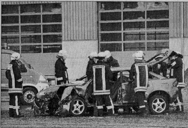
Zuerst mussten die Wehrmänner einen eingeklemmte Autofahrer mit Spezialgerät aus einem Unfallfahrzeug befreien.

Die andere, nicht alltägliche Übungsaufgabe, bestand darin, eine verletzte Person von dem Ausleger eines Baukrans aus 21 Metern Höhe möglichst schonend und sicher zu retten. Hierfür mussten die Mitglieder den Kran für eine Erkundung besteigen. Anschließend brachten sie die angeforderten Gerätschaften, wie Schleifkorbtrage, Feuerwehrleinen, Abseilgerät und entsprechende Anschlagmittel per Leinen nach oben. Die Einsatzkräfte legten die Person in Form einer Übungspuppe nach der Erstversorgung in die Schleifkorbtrage. Hierbei mussten die Feuerwehrmänner auf die be-